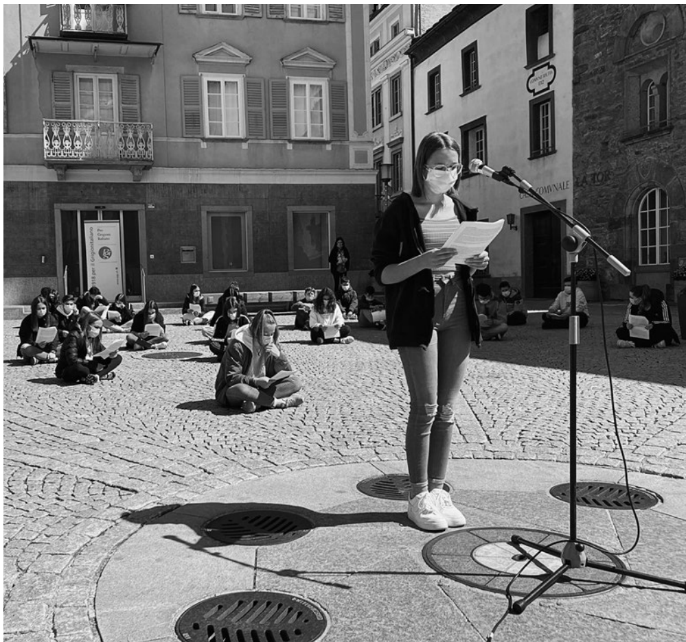
Uno scatto del «flash mob» inscenato sulla piazza di Poschiavo in occasione della «Giornata della lettura ad alta voce»