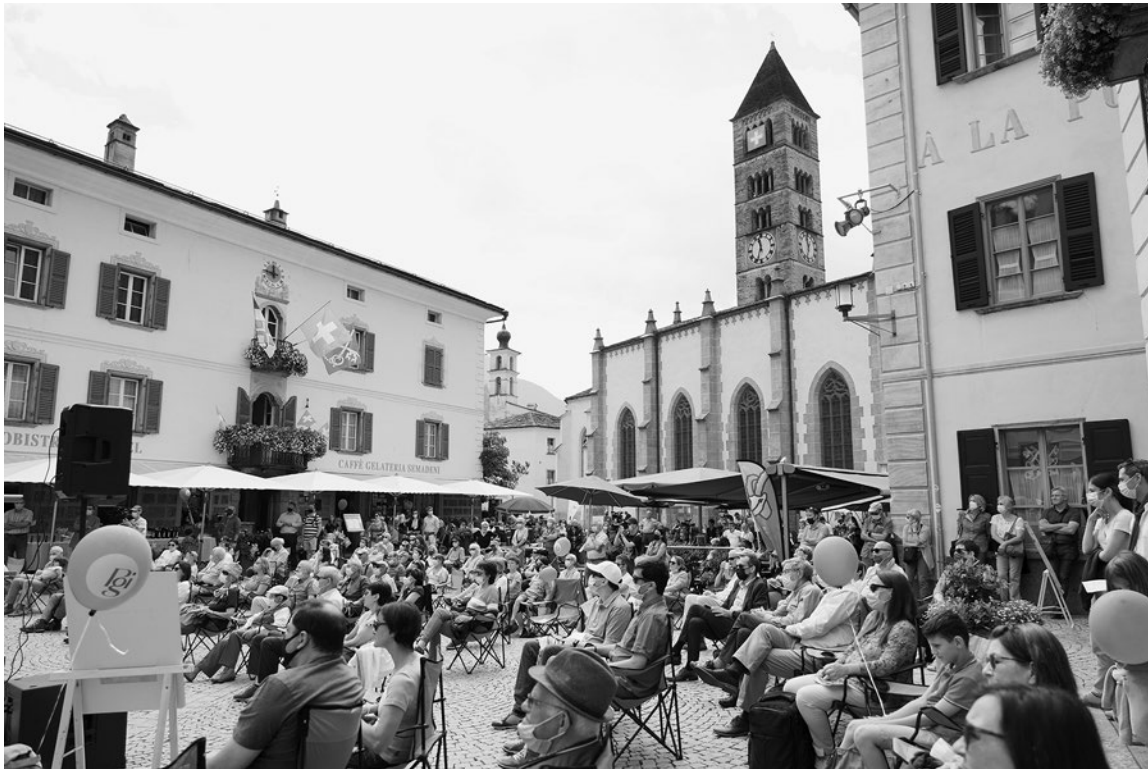
Sulla piazza di Poschiavo durante le «Giornate grigionitaliane»

Il «Manifesto GR3» è stato presentato alla stampa martedì 15 giugno a margine della sessione del Gran Consiglio svoltasi a Davos. Al termine, i presidenti dei gruppi parlamen-