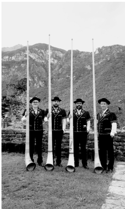
↑ I suonatori di corpo delle Alpi del gruppo «Eco della Mesolcina».

Tra pochi giorni, sabato 7 agosto, sarà inaugurata a Poschiavo la serie di manifestazioni intitolata «Giornate grigionitaliane», che proseguirà fino a domenica 8. Lo scopo dell'evento organizzato dalla Pgi è quello proporre un momento d'incontro e di condivisione fra bregagliotti, calanchini, mesolcinesi e valposchiavini, nonché tra i grigionitaliani che abitano lontani dai territori dove sono cresciuti e nel contempo di presentare il Grigionitaliano a tutti coloro che lo visitano di sfuggita o lo conoscono poco: un'ampia vetrina sulla nostra realtà pensata per persone di età e provenienza diverse.