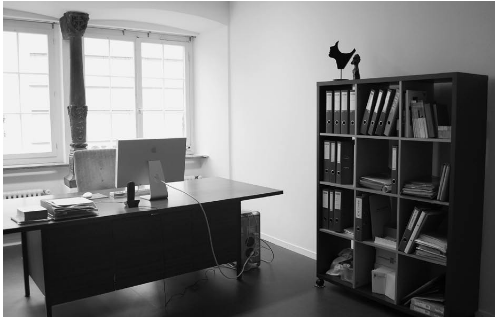
I rinnovati uffici della Sede centrale.

loro archivi. In seguito si provvederà a catalogare questi documenti e a renderli accessibili a tutti coloro che desiderano consultarli. La stessa cosa sarà fatta per tutte le pubblicazioni del Sodalizio.