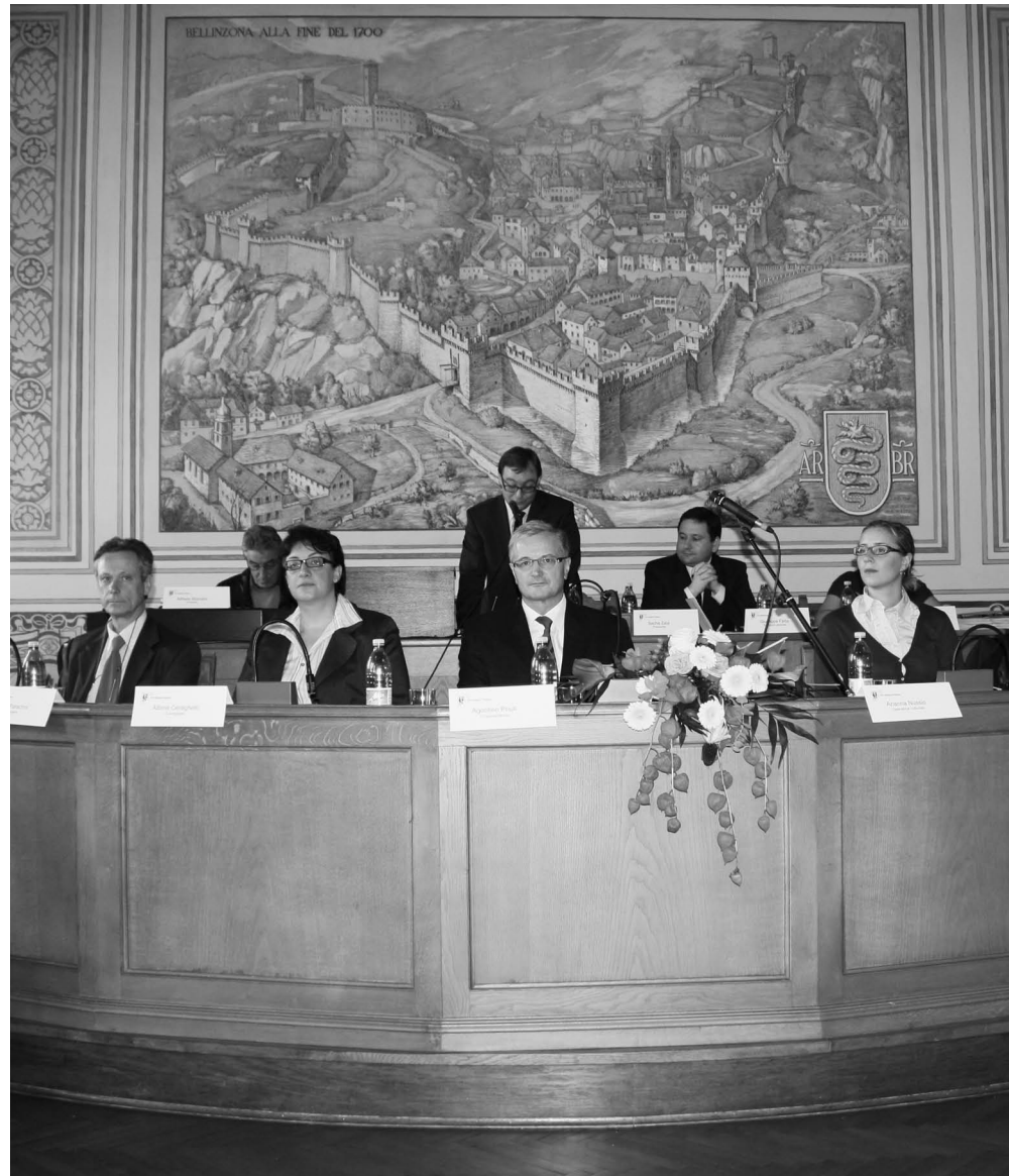
I membri del Cd e della Sede centrale con gli operatori durante l'Assemblea dei delegati 2009 a Bellinzona.