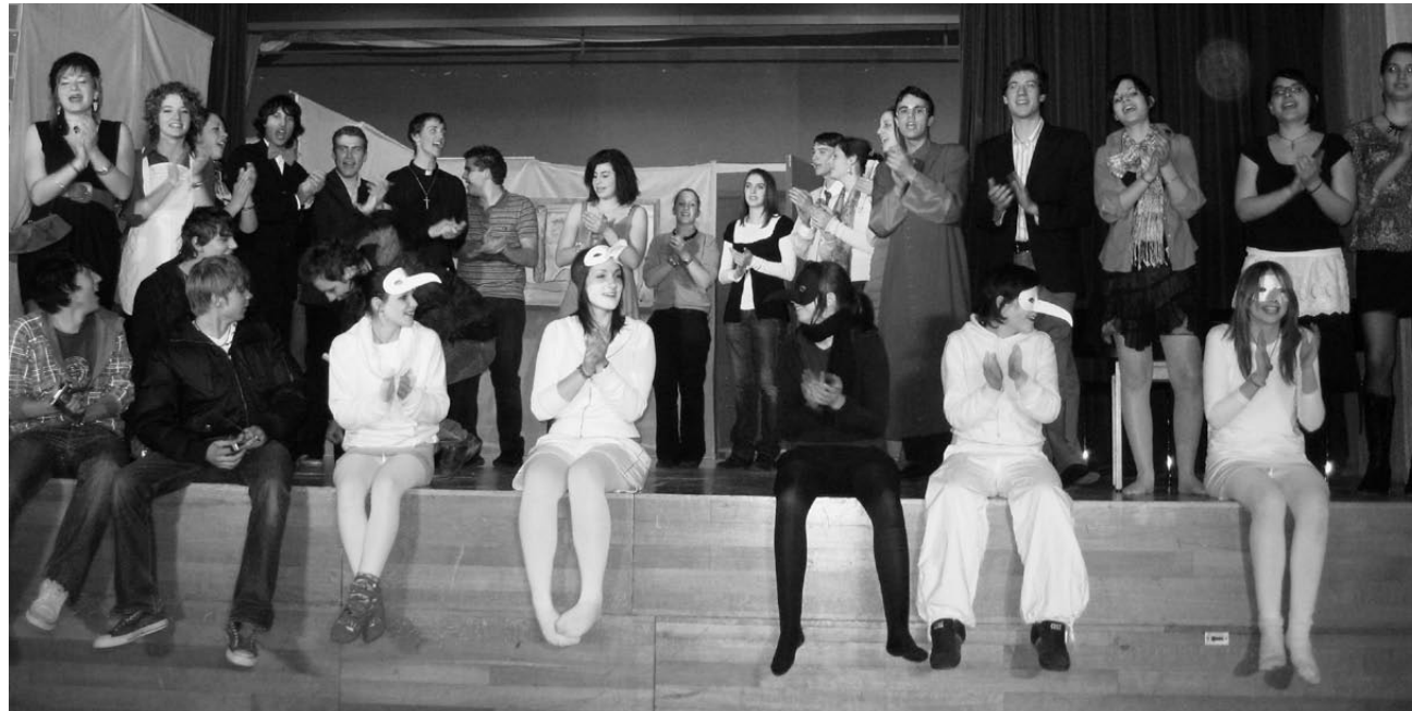
L'annuale rappresentazione teatrale della Pgi giovani – Coro italiano.

Letteratura La programmazione 2009 ha visto come primo appuntamento il corso di letteratura dedicato a Piero Chiara. Nelle tre serate proposte il relatore Giancarlo Sala ha permesso ai partecipanti di conoscere e approfondire le opere e la vita dell'autore attraverso letture, spezzoni di film e racconti biografici. Nel corso dell'anno altri due sono stati gli incontri in ambito letterario: durante il mese di febbraio lo scrittore ticinese Alberto Nessi ha presentato il suo ultimo lavoro La prossima settimana, forse . A marzo, al termine dell'Assemblea dei soci, è stato ospite Giovanni Orelli, il quale, partendo da alcuni spunti presi dall'antologia Scrittori del Grigion Italiano edita dalla Pgi, ha trattato alcune tematiche legate agli scrittori grigionitaliani e alle loro opere, dando vita ad un