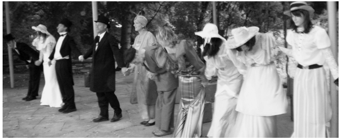
Teatro al lago