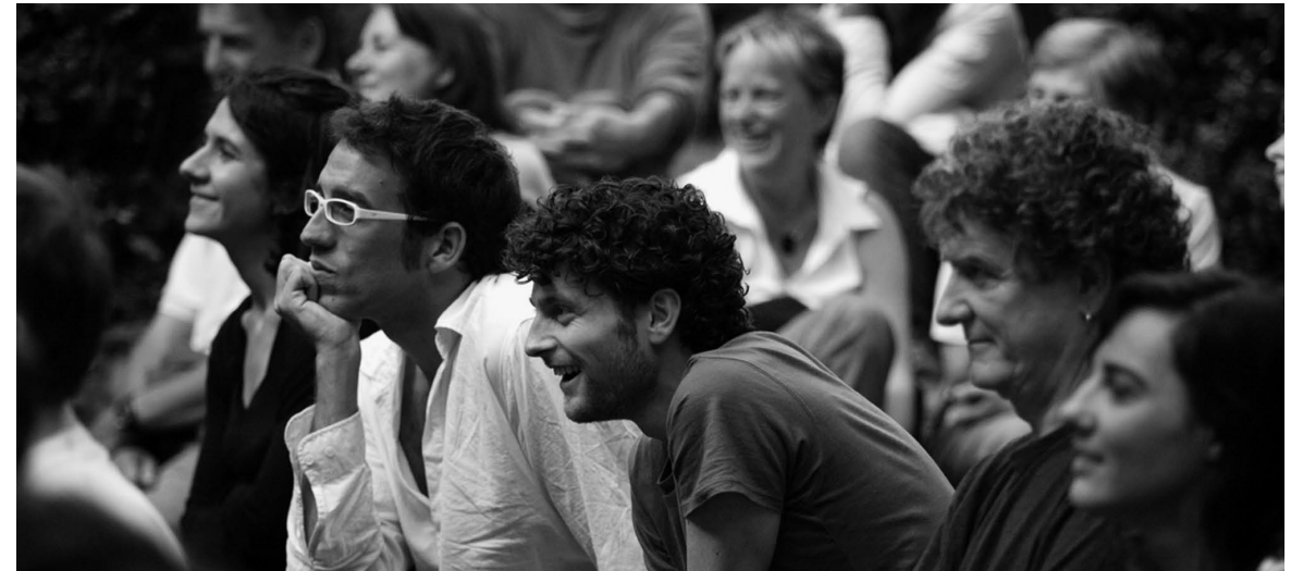
Terzo Festival di Teatro al Castelmur, foto: Corrado Marzullo.

Musica Numerosissimi i concerti organizzati su iniziativa della Sezione, proposti in collaborazione con altri promotori o che la Sezione ha accolto con un sostegno logistico. La stagione concertistica 2009 si è aperta a giugno nel Salone di Palazzo Castelmur di Coltura, con una serata all'insegna del tango argentino insieme al Trio Martes di Basilea. Ha fatto seguito in agosto il concerto