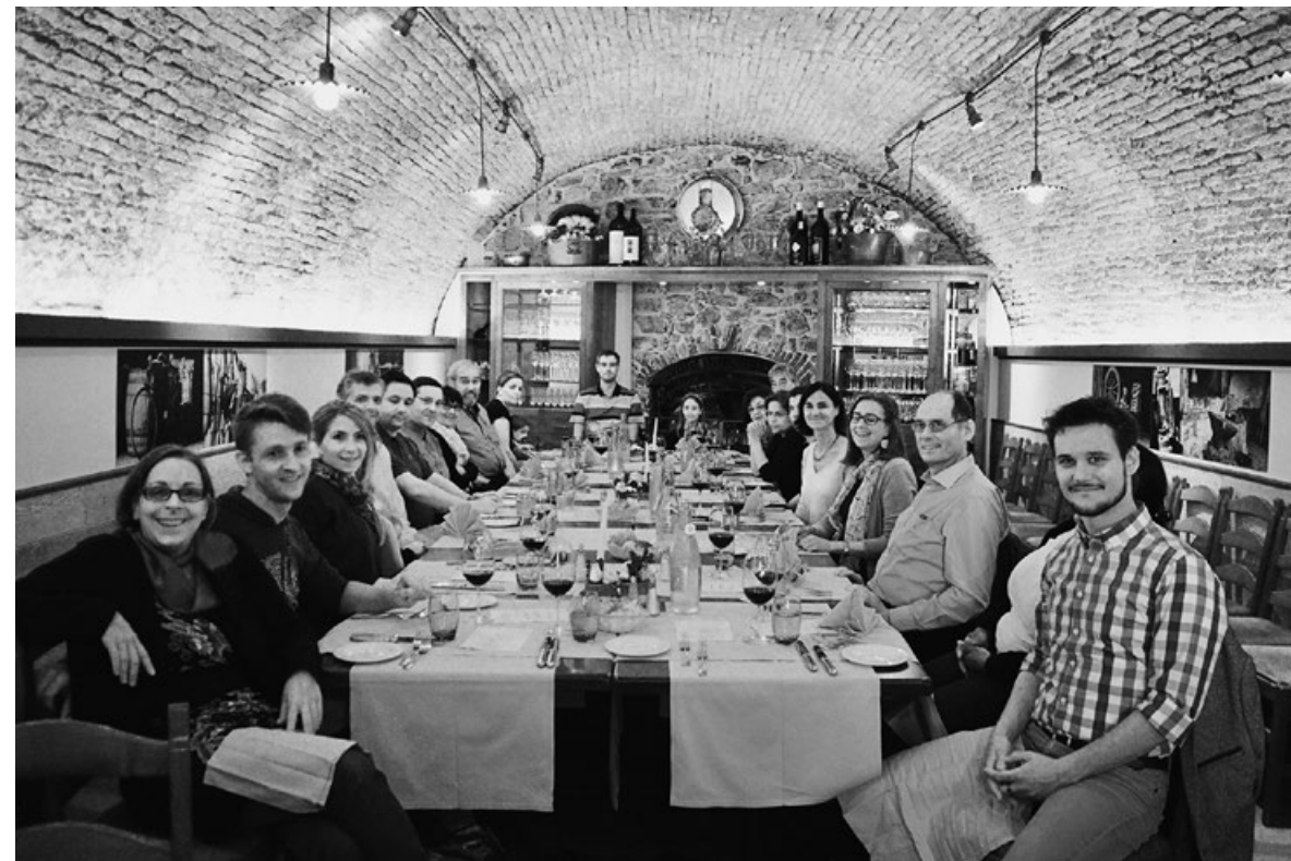
Anche l'allegria serve a rafforzare l'unità del Sodalizio. Il gruppo del seminario quadri Pgi (maggio 2015) conclude i lavori intorno a un grande tavolo alle Cantine di Mendrisio