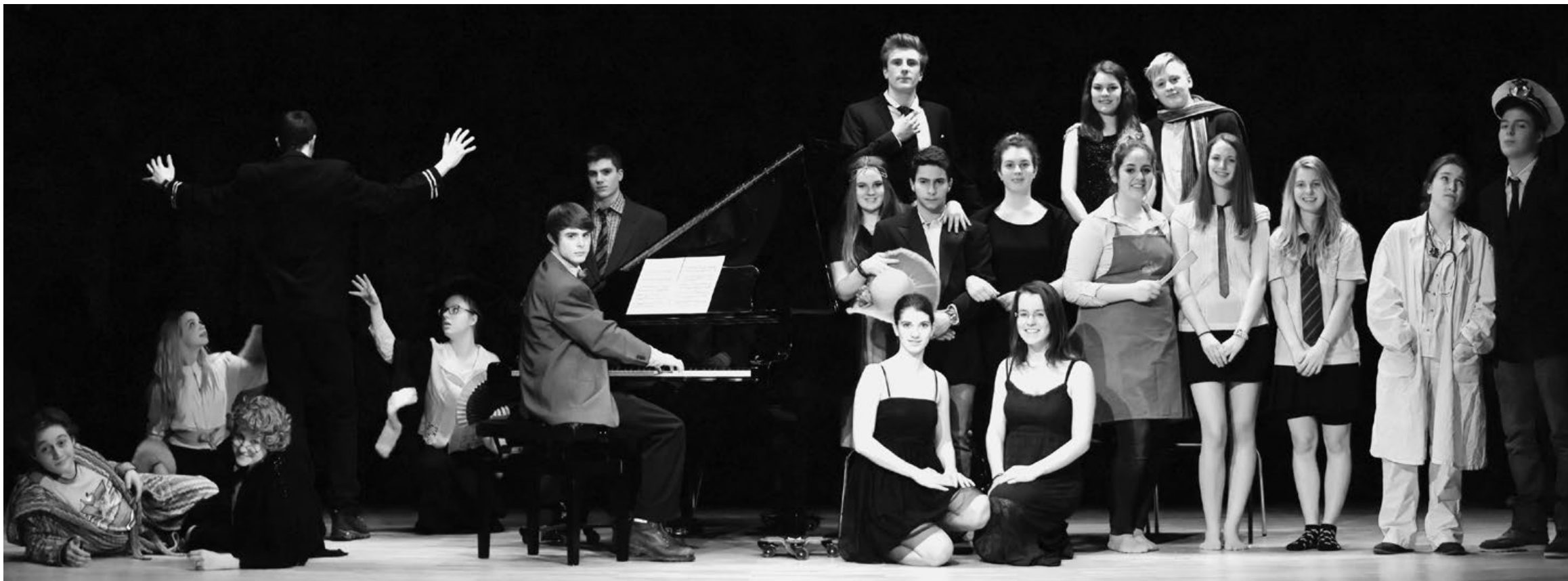
Una lunga storia di successi: i giovani del Coro italiano Pgi hanno attraccato a tutti i porti del Grigionitano, a Coira e in Engadina con il loro esilarante spettacolo "Freccia Blu"

Teatro Il IX Festival di teatro al Castelmur, curato da Piera Gianotti e Emanuel Rosenberg, ha visto in scena lo spettacolo La bicicletta rossa della compagnia Principio Attivo Teatro , lo spettacolo di teatro-danza Piccoli grandi cambiamenti della Company Mafalda e il delicato spettacolo di teatro di burattini Manoviva realizzato sul «teatro-bus» della compagnia Girovago e Rondella . La proposta della compagnia Teatro Pan con Imbuteatro , un'esibizione personalizzata da ascoltare ad occhi chiusi e con orecchi ben attaccati agli «imbutubi», ha fatto sognare grandi e piccini. A chiudere la serata è stato lo spettacolo con il fuoco Brulé , di Francesco Manenti e con l'accompagnamento mu-