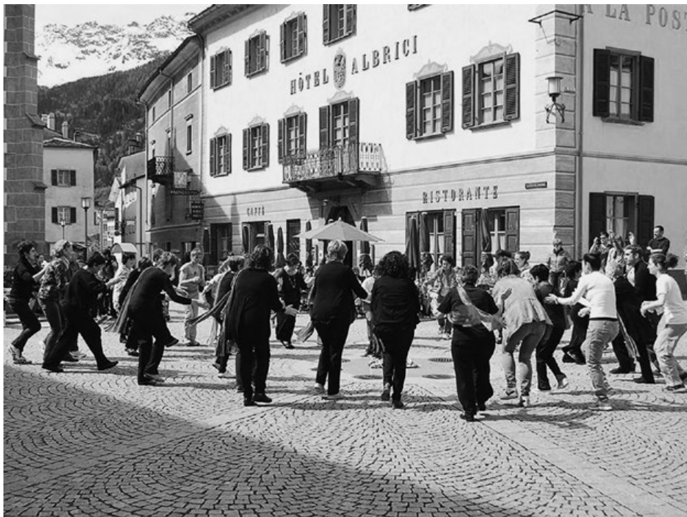
Momenti d'intensa vivacità: la piazza del Borgo di Poschiavo è invasa dal movimento della "Festa danzante"

pubblico. A settembre l'associazione ha invece avuto il piacere di presentare Edipo , film muto girato in Valposchiavo; la prima opera cinematografica dell'eccellente artista Cornelia Müller è stata presentata davanti a un numeroso pubblico con l'esclusivo commento musicale di The Magic Science Quartet .